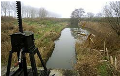
Het nog net niet helemaal vergane haventje Paviljoen.

Overschelde heet het plan om via de Hals van Zuid-Beveland de Wester- en Oosterschelde met elkaar in verbinding te brengen. Of het zover komt, is nog onduidelijk; er wordt in elk geval serieus onderzoek naar gedaan. Als het doorgaat, betekent het een terugkeer naar de oude situatie, van vóór 1867. Aanleg van de Kreekrakdam voor de nieuwe spoorlijn Bergen op Zoom-Vlissingen koppelde Zuid-Beveland aan Brabant en er kwam een eind aan de eeuwenoude uitwisseling tussen Wester- en Oosterschelde.